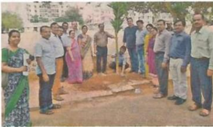
మొక్కలు నాటుతున్న కృష్ణ కళాశాల సిబ్బంది, విద్యార్థులు

విద్యార్థులు స్వచ్ఛభారత్ కార్యక్రమాన్ని నిర్వహించారు. స్వచ్ఛ పక్కా కార్యక్రమంలో